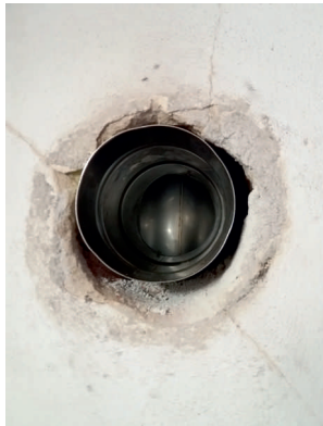
Osazený T-klix s vodorovnou částí