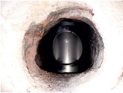
Osazený T-klix bez vodorovné části