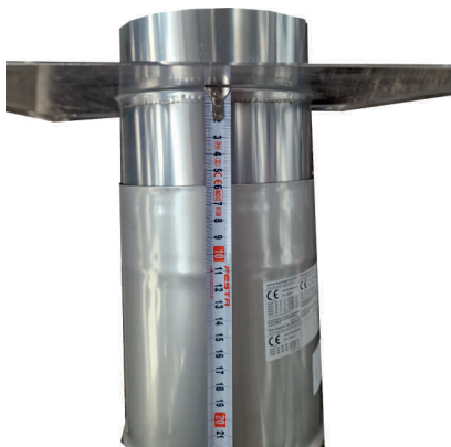
Ukončení komínu, dilatace vložky