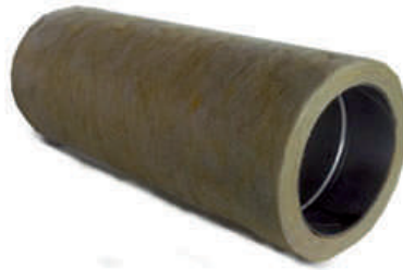
Nerezová vložka osazená do izolace

V případě, že rozměr zděného komínu je dostatečně velký, je vhodné nerezovou komínovou vložku osadit do izolační skořepiny ( FU3925 ). Izolace má tl. 25mm., zajistí stabilnější teplotu spalin, tedy optimální tah a snížení kondenzace. Pro její použití musí být tedy komín větší alespoň o 60mm, než je vnitřní průměr vložky. V tomto případě je také vhodné pro vystředění v komíně lze použít sponu ( FU40 ). Spona se aplikuje cca každé 3-4 výškové metry.