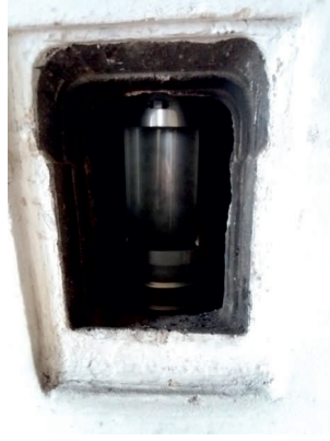
Osazení čistícího prvku